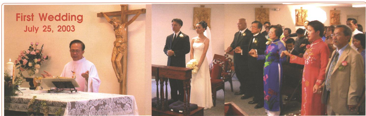
First Wedding July 25, 2003

Đền Thánh Mẹ, nhà của ta. No place like home!