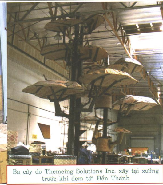
Ba cây do Themeing Solutions Inc. xây tại xưởng trước khi đem tới Đền Thánh