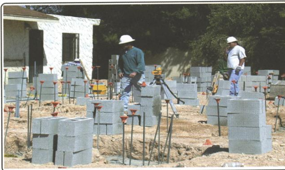
Construction started on February 4, 2003 by the Korte Company